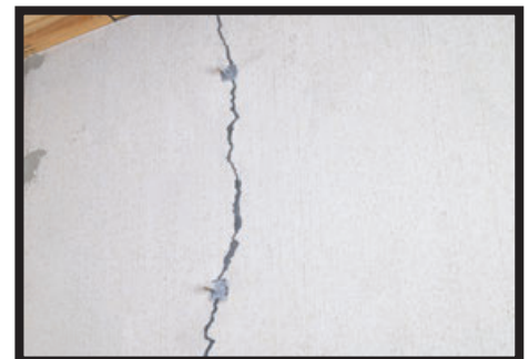
03: Cover over previously marked locations