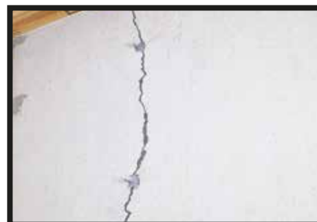
03 : Recouvrez les emplacements marqués précédemment.