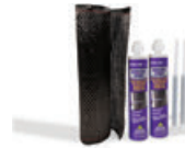
DRICORE™ PRO Concrete Repair Carbon Fiber Reinforcement Kit