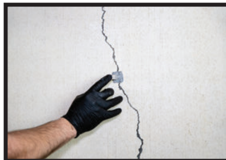
02: Press injection port firmly directly over the crack