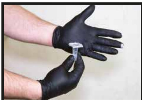
01 : Roulez le port d'injection dans la PÂTE DE PRÉPARATION DE SURFACE POUR RÉPARATION DE FISSURES DRICORE MC PRO RÉPARATION DU BÉTON.