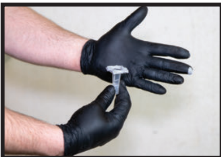
01: Roll the injection port in DRICORE™ PRO CONCRETE REPAIR CRACK PREP SURFACE PASTE