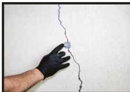
02 : En appuyant fermement, placez le port d'injection directement sur la fissure.